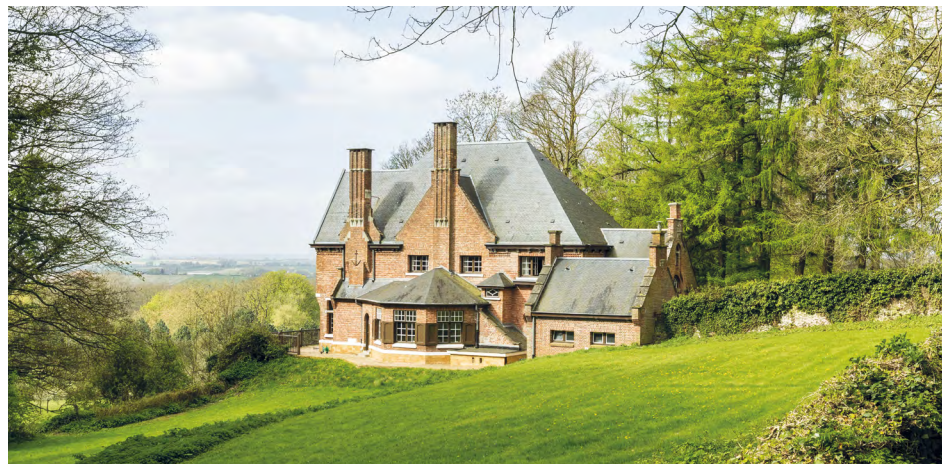
Villa Marguerite Yourcenar

La Villa départementale Marguerite Yourcenar – résidence d'écritures du Département du Nord – située au Mont Noir, sur l'ancienne propriété de la famille de Marguerite Yourcenar, accueille chaque année des autrices et auteurs en résidence d'écriture et organise une programmation culturelle et de nombreuses manifestations mettant à l'honneur les livres et la lecture en direction du plus grand nombre.