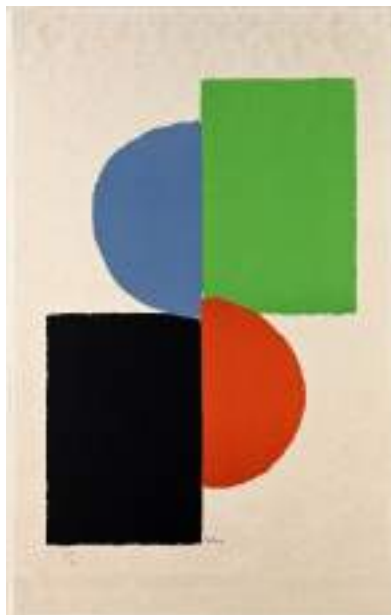
Sonia Delaunay : Formes, 1970, lithographie sur papier, collection LAAC, Dunkerque

Cette œuvre est une lithographie , c'est-à-dire un dessin réalisé sur pierre puis imprimé en 30 exemplaires. Elle est uniquement composée par quatre formes géométriques : deux rectangles et deux demi-disques organisés selon une symétrie centrale .