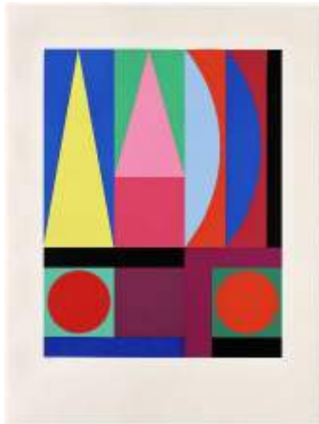
Auguste HERBIN : Clarté, 1959, sérigraphie sur papier, collection LAAC, Dunkerque © ADAGP, Paris, 2026

Cette œuvre est une composition abstraite dans laquelle sont assemblées des formes géométriques simples : cercles, triangles, rectangles... Les couleurs sont franches, souvent primaires ou complémentaires ; elles produisent un effet de netteté et de lisibilité. La composition repose sur un équilibre entre verticales, horizontales et masses colorées : aucune profondeur n'est suggérée, l'artiste mettant en avant l' espace littéral de la toile. Cette organisation crée une sensation de lumière, d'harmonie et de stabilité, en cohérence avec le titre « Clarté ». L'œuvre ne cherche pas à représenter le réel mais à exprimer une idée ou une sensation par la seule force des éléments plastiques.