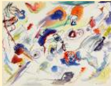
Vassily Kandinsky : Sans titre, 1913

En 1910, le peintre Vassily Kandinsky se rend compte que représenter des objets empêche ses tableaux d'exister vraiment par eux-mêmes. Il décide alors de peindre sans représenter des objets connus, juste avec des formes, des lignes et des couleurs qui n'évoquent rien de reconnaissable. D'autres peintres comme Kasimir Malevitch, Piet Mondrian ou Hilma af Klint vont, au même moment, s'engager dans cette voie. Et c'est cette idée — faire de l'art qui ne ressemble à rien de réel — qui marque la naissance de l'abstraction.