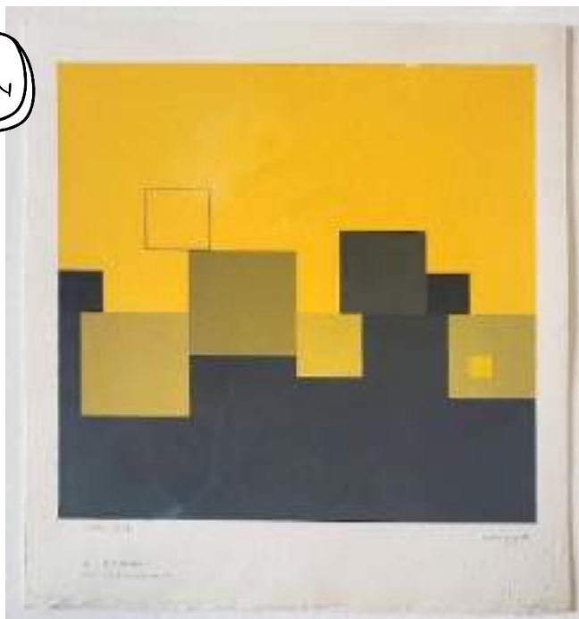
Guy De LUSSIGNY : Sans titre, 1972, acrylique sur papier Arches, collection LAAC, Dunkerque

Cette œuvre est composée de carrés de différentes tailles. Leurs contours sont nets et précis : on a l'impression que l'image a été réalisée par un ordinateur.